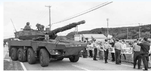
公道を走行する陸自戦闘車 2022/11/17 沖縄 与那国島